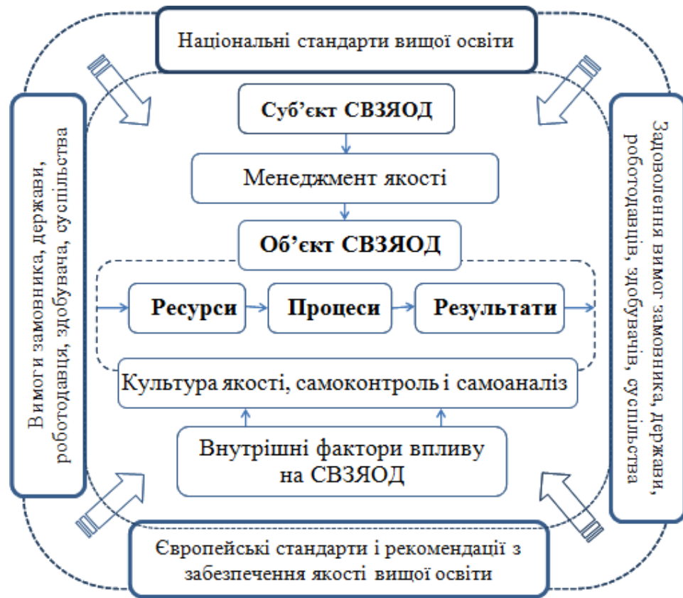
Рис. 1. Взаємозв'язок елементів системи внутрішнього забезпечення якості освітньої діяльності КНУТД

– запобігання будь-яким випадкам нетолерантності чи дискримінації щодо здобувачів вищої освіти;