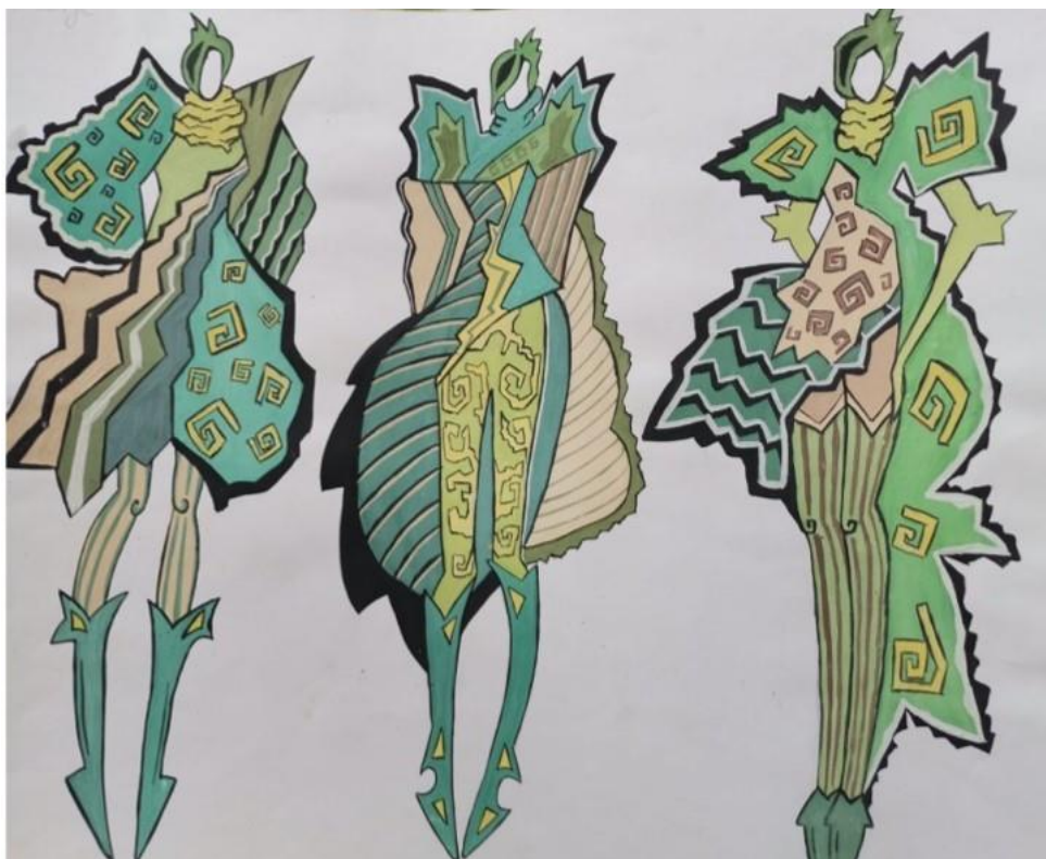
Рис. А.2. Приклад виконання екзаменаційного завдання 2