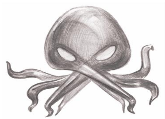
Рис.2 Приклади стилізації