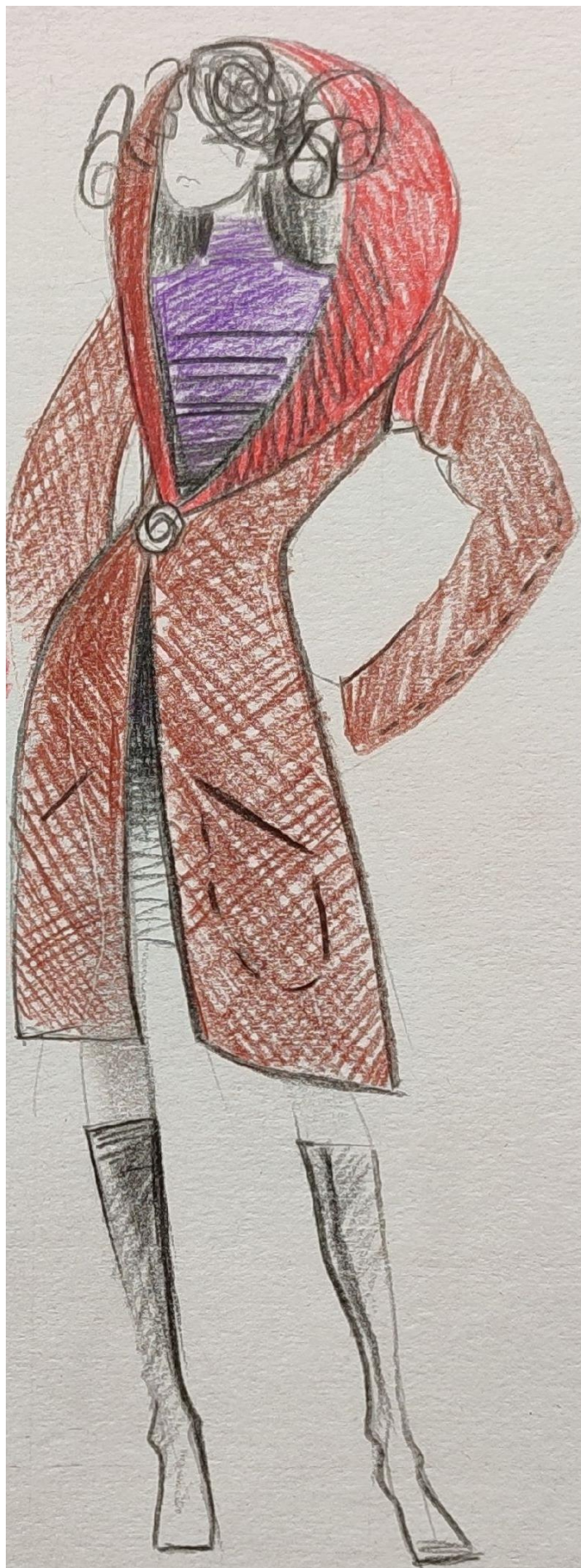
Рис. А.2. Приклад виконання практичної частини завдання 2.2 фахового іспиту