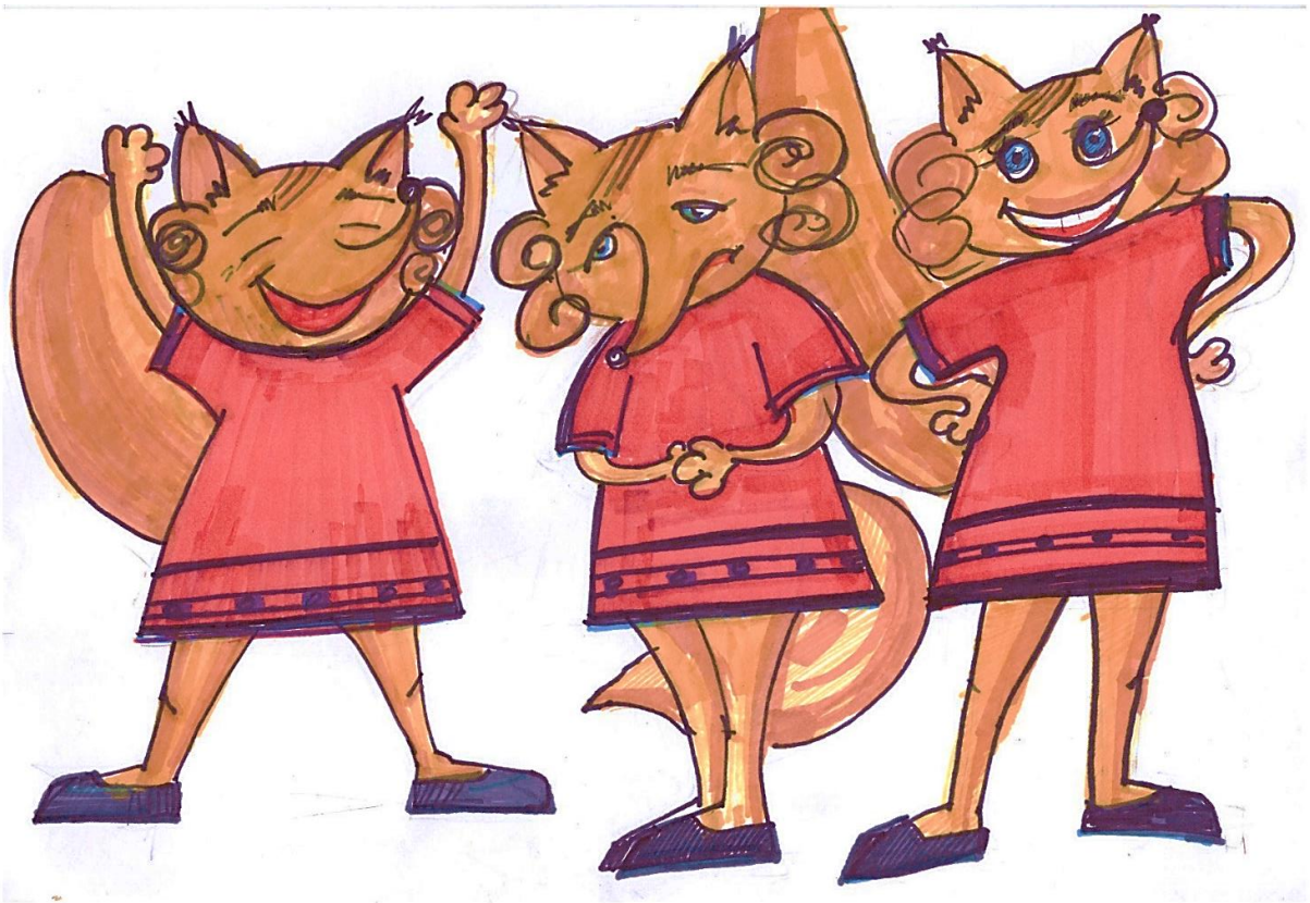
Рис. А.2. Приклад виконання практичної частини завдання 2.2 фахового іспиту