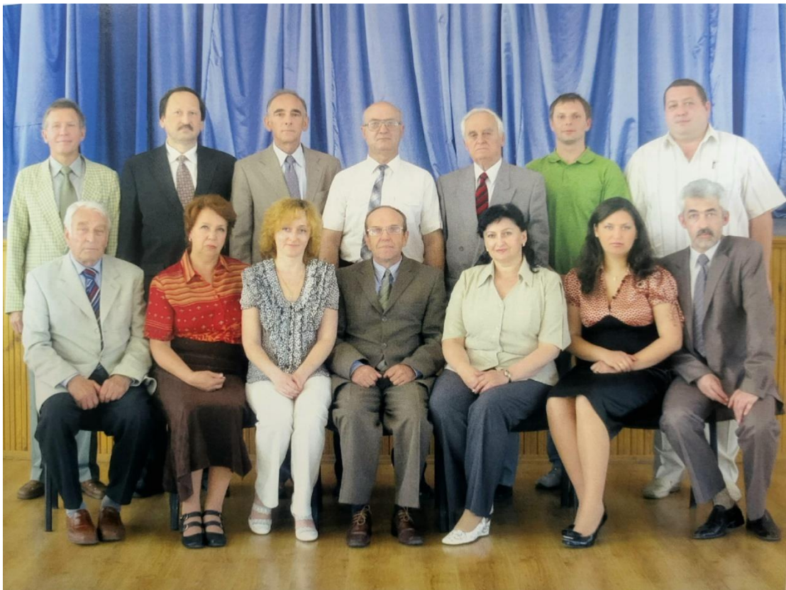
Колектив кафедри графіки та нарисної геометрії (2010 рік).

Викладалися дисципліни: нарисна геометрія; технічне креслення; нарисна геометрія і креслення, інженерна графіка; нарисна геометрія, інженерна та комп'ютерної графіка; інженерна та комп'ютерної графіка в проектуванні обладнання; перспектива та тіні, геометрія поверхонь виробів.