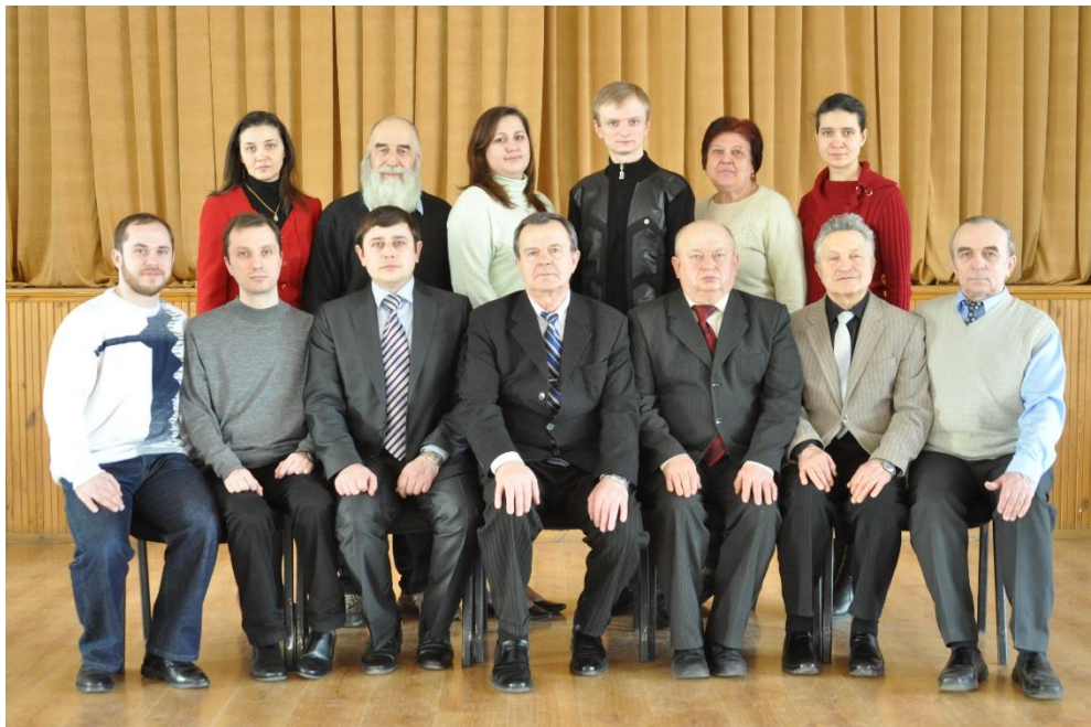
Колектив кафедри машин легкої промисловості, 2011 рік