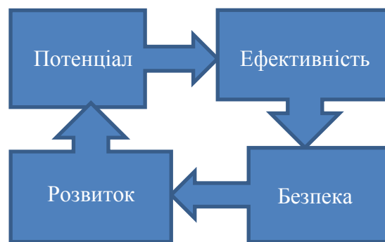
Рис. 2. Взаємозв'язок потенціалу, економічної безпеки та розвитку економічної системи (розроблено автором)

Загалом у процесі дослідження автором зроблено висновок про тісний циклічний зв'язок між потенціалом, ефективністю, економічною безпекою та розвитком економічної системи.