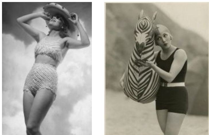
Рис. 4. Одяг для купання 1930-х років:

У 1940-х роках жінки все більше ставилися до купальних костюмів як до засобу кокетства і спокушання, надягали до нього модельні туфлі на високих підборах і дорогі прикраси в якості аксесуарів. У 1946 році