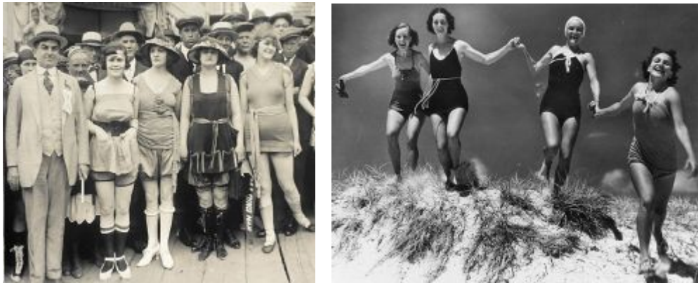
Рис. 3. Одяг для купання 1910-1920-х років

Не зважаючи на те, що новий купальний костюм викликав бурхливий протест у деяких представників суспільства, вже в 1930-ті роки з'явилося нове покоління дизайнерів, які проектували купальні костюми з розрахунку на функціональність, еластичність і простоту. Жінки тепер купалися в суцільних комбінезонах або у високих шортах та скромному бюстгальтері на широких бретельках, які можна було спустити для більш рівного загару (рис. 4). І хоча суворі закриті купальники з короткою спідницею також користувалися популярністю, важливим було те, що жінки вже по іншому сприймали одяг і своє тіло.