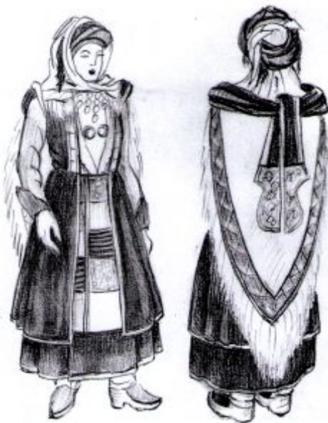
Рис. 1. Рачинцы в традиционном костюме

В последнее время популярными стали рачинские танцы, в которых используемые танцевальные костюмы радикально отличаются от традиционной рачинской одежды. Женская рачинская одежда значительно отличается от традиционного костюма других горных регионов Грузии, а костюм мужчин аналогичен традиционному грузинскому костюму мужчин.