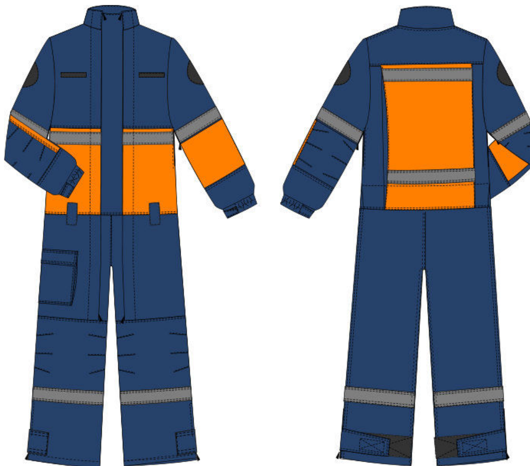
Рис1. Загальний вигляд захисного комбінезона для ведення аварійно-рятувальних робіт

Нами запропоновано дизайн-ергономічне рішення захисного комбінезону для ведення аварійно-рятувальних робіт в цивільній авіації, яке представлено на рисунку 1. Його конструкція враховує вплив небезпечних та шкідливих факторів виробничого середовища, є ергономічною та естетично доцільною.