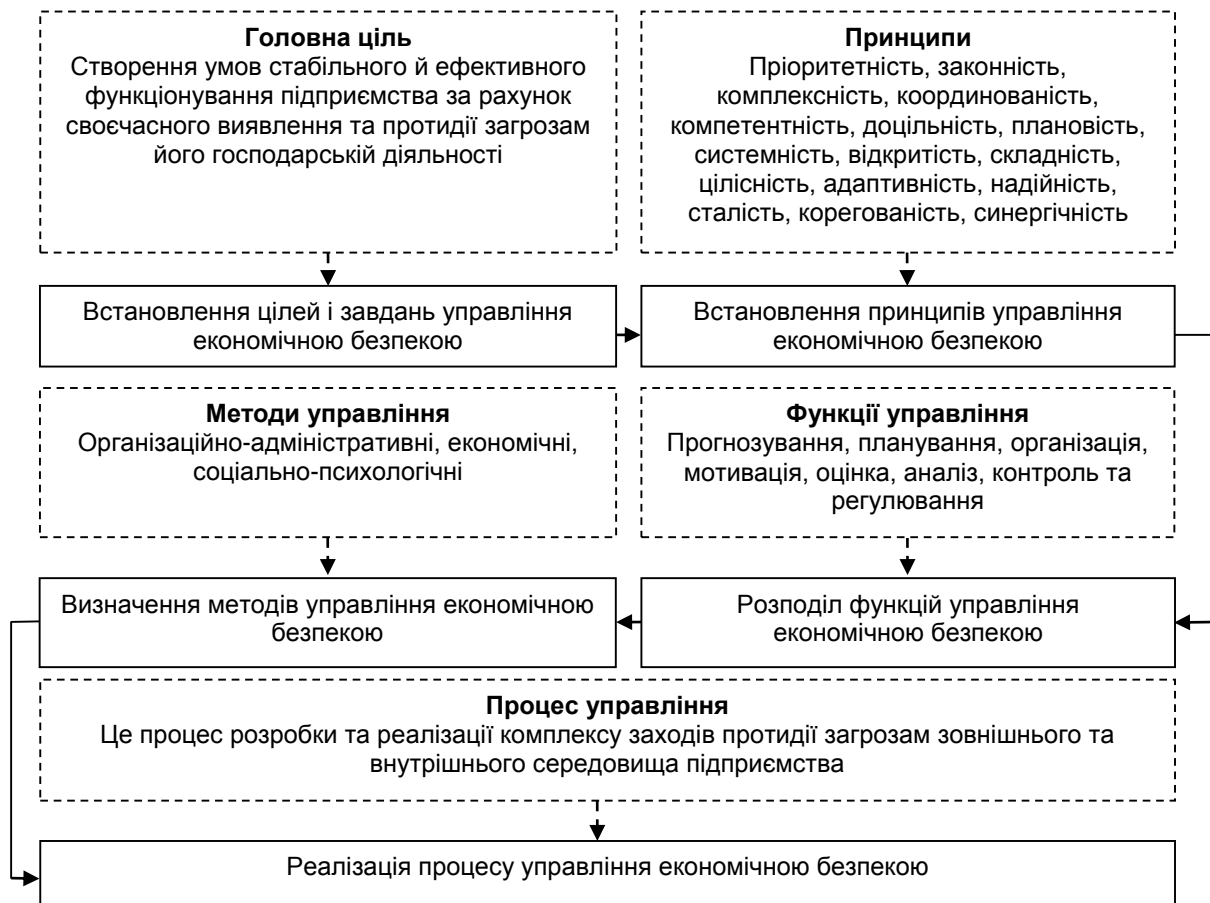
Рис. 1. Модель реалізації процесу управління економічною безпекою підприємства

результати дозволяють оцінити ефективність впровадження заходів передбачених стратегією безпечного розвитку.