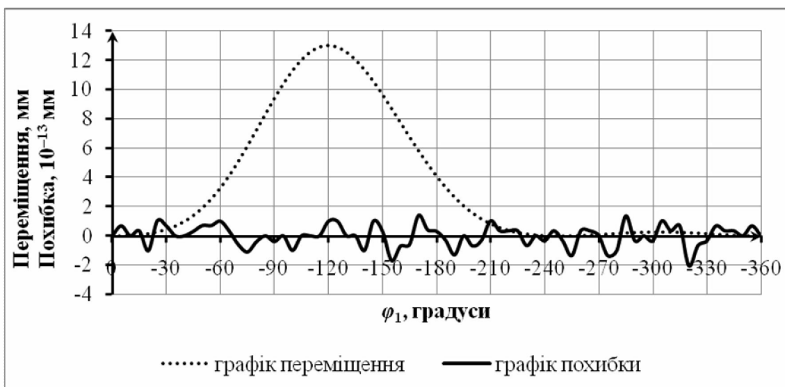
Рис. 3. Графік функції переміщення вушкової голки машини ОВ-7 суміщений з графіком абсолютної похибки між функціями переміщення вушкової голки, що отримані в цій роботі та за методом векторного перетворення координат у роботі [3]

На рис. 3 значення функції переміщення вушкової голки узяті у міліметрах, а значення похибки переміщення – у 10^{-13} мм. Таким чином, зважаючи на мізерно малу величину похибки, що несумірна з переміщенням вушкової голки, можна вважати, що результати розрахунку функцій переміщення за двома способами цілком і повністю співпадають один з одним.