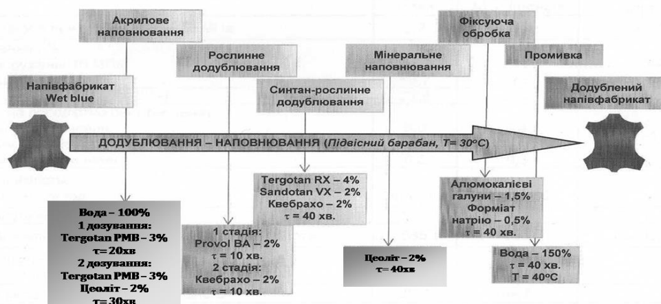
Рис.3. Технологічна схема до дублювання-наповнювання з використанням модифікованих дисперсій цеоліту в кількості 4% від маси струганого напівфабрикату

Для дослідження процесу наповнювання дисперсіями цеоліту взяли типову методику проведення післядубильних процесів виробництва хромових шкір для верху взуття. В якості диспергатора використовували полімерні сполуки фосфору в кількості 10% від маси сухого мінералу. Дослідження проводили на 6 групах зразків, отриманих за діючою технологією виробництва хромової шкіри для верху взуття ЗАТ «Чинбар». Кожна група включала 6 зразків розміром 50×150 мм, товщиною напівфабрикату після стругання 1,3-1,4 мм. Варіант наповнювання напівфабрикату з використанням для мінерального наповнювання Танікор FTG вважали контрольним. Всі рідинні процеси виконувались однаково для всіх партій, але з використанням різних наповнювальних матеріалів. Технологія додублювання-наповнювання передбачає дозування дисперсій цеоліту в дві стадії: на стадії обробки напівфабрикату акриловим наповнювачем та після додублювання квебрахо, схема якої представлена на рис. 3.