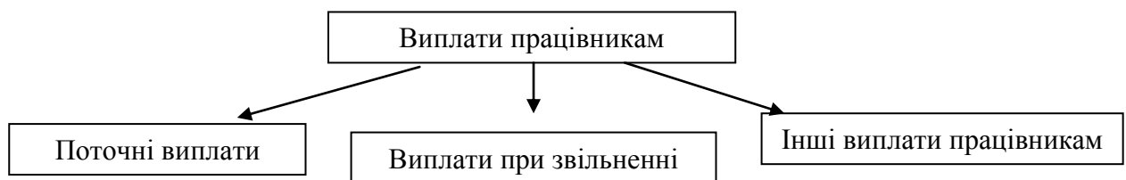
Рис 1. Групи виплат працівникам

Національним положенням (стандартом) бухгалтерського обліку в державному секторі 132 «Виплати працівникам», встановлено методичний фундамент для створення в бухгалтерському обліку інформації щодо виплат працівникам, та її розкриття у фінансовій звітності [1]. В цілому виплати працівникам діляться на три групи (рис. 1.).