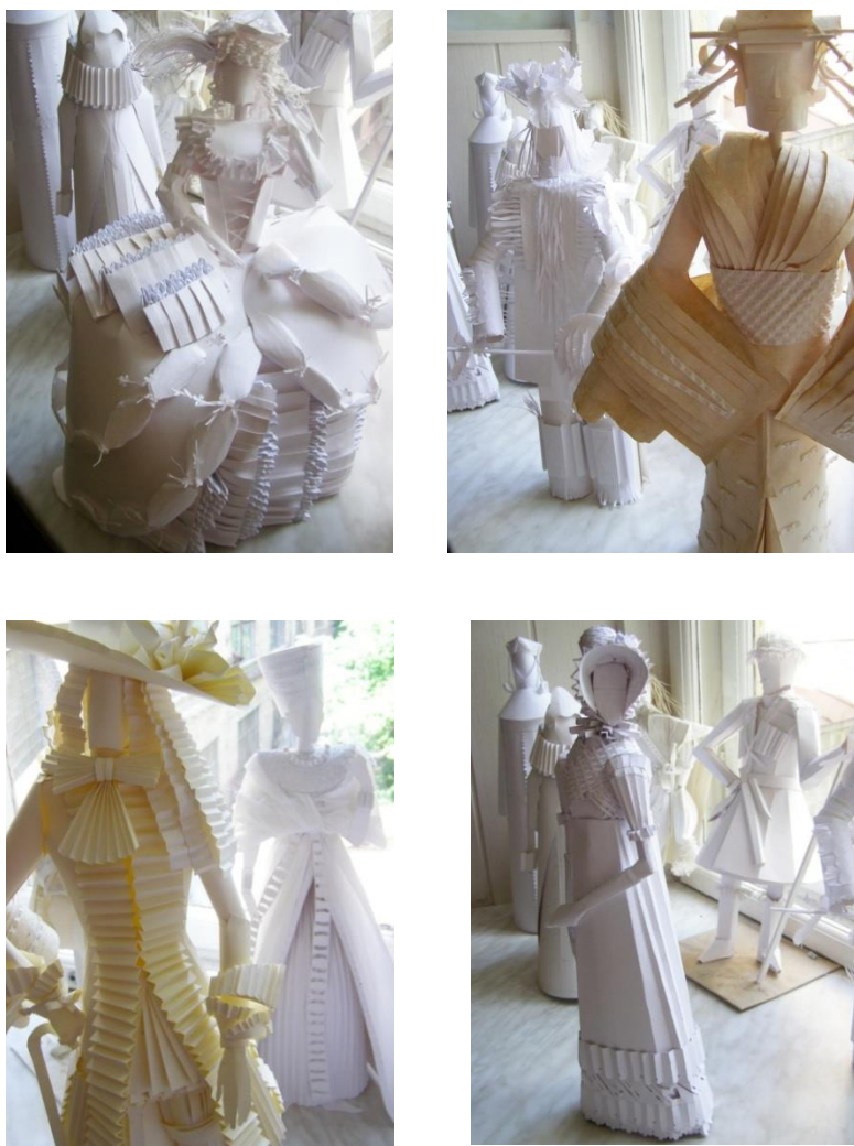
Рис. 2. Макет історичного костюма з паперу (авторська розробка)

4. На основі результатів проведеного аналізу тектонічної побудови форми історичного костюма, виконується об'ємний макет з паперу, в якому повинні бути втілені результати досліджень його провідних тектонічних характеристик, використані знання та навички прийомів об'ємного формоутворення з плоских матеріалів (рис. 2.).