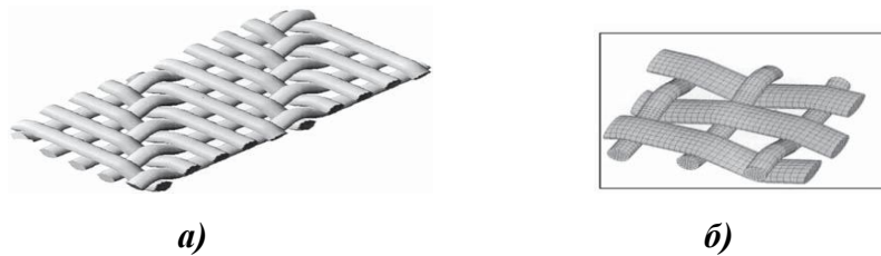
Рис. 1. а) структура тканини саржевого переплетення \frac{1}{4} , б) – форма наскрізних пор в тканині полотняного переплетення

структурі наскрізних пор (рис.1), їх розмірами та розподілом за розмірами. Наскрізними в тканинах вважаються ті пори, які при розгляданні зразка в оптичному мікроскопі при проникаючому світлі дають світлову проекцію [1].