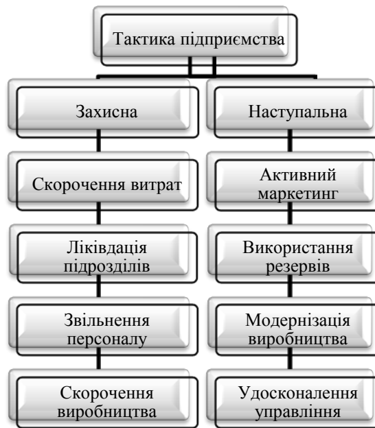
Рис. 1. Види тактик антикризового управління на підприємстві

На сьогодні існує дві найпоширеніші тактики, що дають змогу перебороти кризову ситуацію (рис. 1). Перша називається захисною, оскільки заснована на заходах збереження, тобто скорочення всіх витрат, пов'язаних з виробництвом і збутом, утриманням основних засобів і персоналу, що призводить до скорочення виробництва загалом. Така тактика, як правило, застосовується при дуже несприятливому збігу зовнішніх для підприємства обставин.