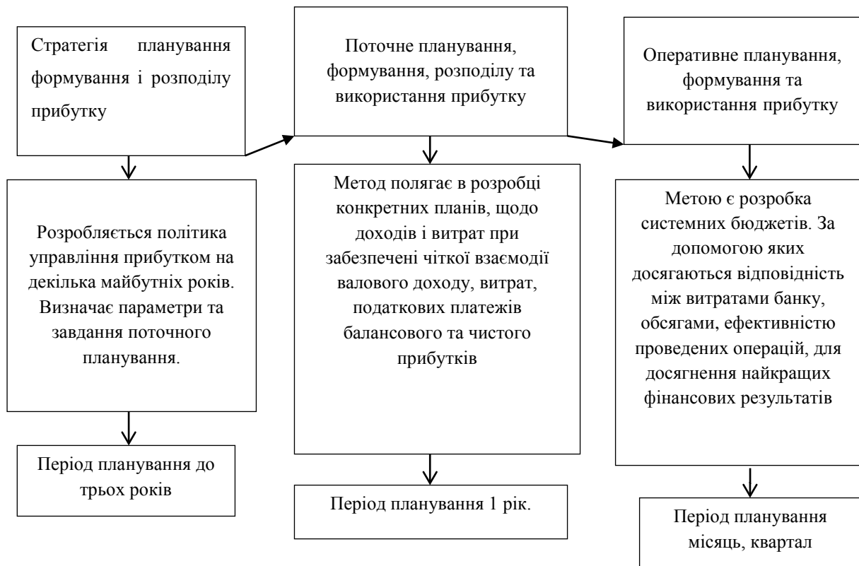
Рис. 3 Система планування прибутку та форми його реалізації в діяльності комерційного банку [2]

В сучасній практиці застосовується безліч різноманітних методів управління прибутковістю для забезпечення стійкого фінансового стану банку. Але, насамперед, з метою підвищення рівня прибутків необхідно здійснювати комплексний аналіз доходів та витрат, виявляти фактори впливу на них, збільшувати резерви діяльності. Також увагу потрібно надавати аналізу структурних компонентів прибутку, співвідношенню активів і пасивів, доходів та витрат для прогнозування фінансового стану комерційного банку.