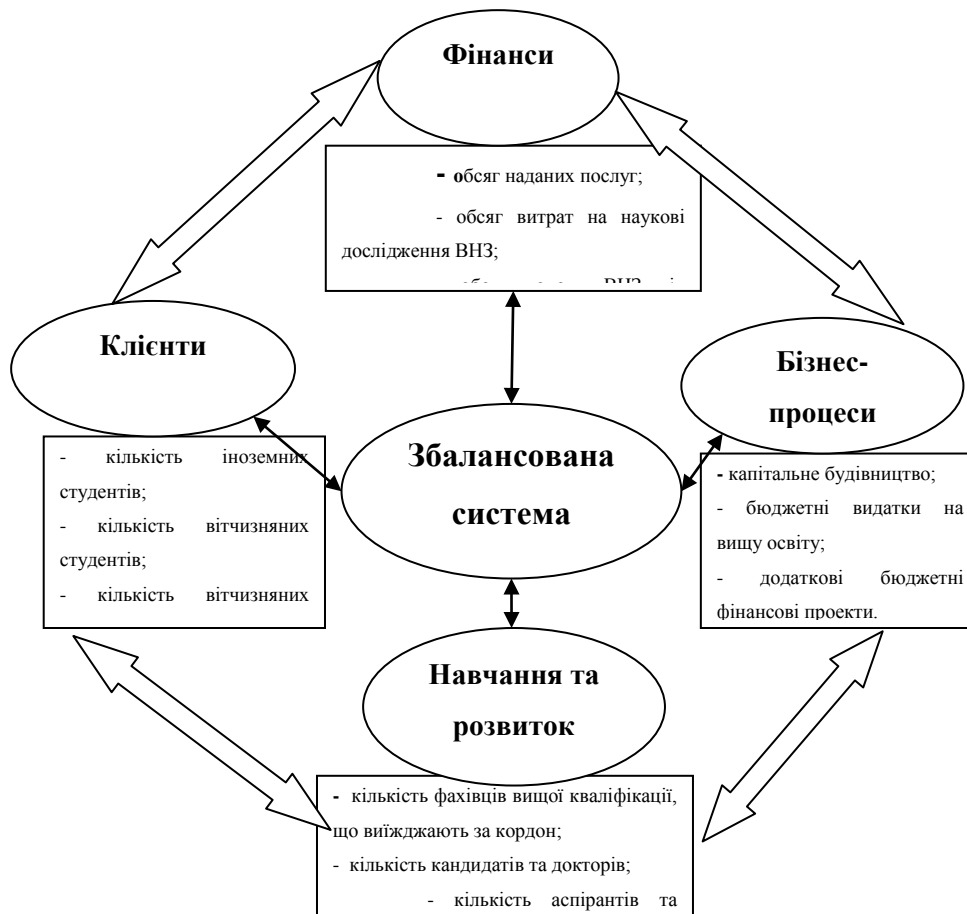
Рис. 1. Адаптована збалансована система показників для оцінки ринку освітніх послуг (розроблено автором)

У адаптованій ЗСП залишаються чотири ключові складові: фінанси, клієнти, бізнес-процеси й навчання та розвиток персоналу. Але кожен складову повинні визначати відповідні показники (рис. 1).