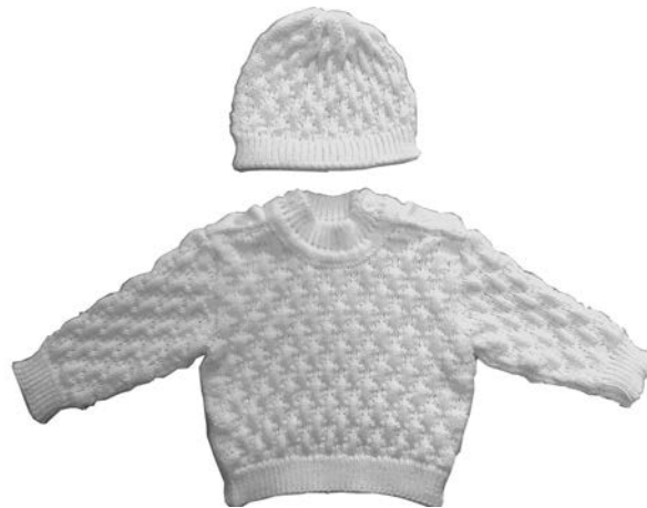
Рис. 2. Трикотажний комплект для новонародженої дитини (авторська розробка)

В основу художньо-конструкторського рішення комплекту трикотажного дитячого покладені утилітарні функції, визначені віковою групою дітей, для яких призначений виріб: гарні гігієнічні, теплозахисні властивості, комфортність та властивості поверхні трикотажу неповного пресового переплетення з високим індексом пресової петлі утворювати рельєфно-ажурний ефект. Деталі пілочки, спинки, рукавів, бейки, планки та шапочка з'єднані кетельним швом для максимальної м'якості і комфортності при носінні. Колористичне рішення виробу побудоване на використанні світлих та чистих тонів, що створює радісний, святковий настрій.