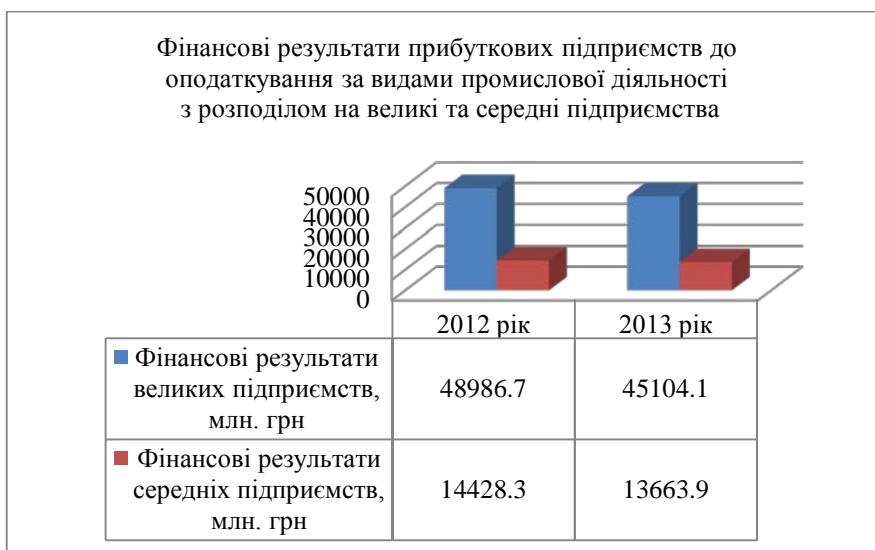
Рис.2 Фінансові результати прибуткових підприємств за видами промислової діяльності [6]

Як видно з рис.1, фінансові результати прибуткових великих підприємств за видами економічної діяльності у 2013 році знизились порівняно з 2012 роком на 7441,7 млн. грн. (10,5%), а фінансові результати середніх підприємств зросли на 5857,7 млн. грн.(14,0%).