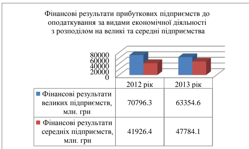
Рис.1 Фінансові результати прибуткових підприємств за видами економічної діяльності [6]

Як видно з рис.1, фінансові результати прибуткових великих підприємств за видами економічної діяльності у 2013 році знизились порівняно з 2012 роком на 7441,7 млн. грн. (10,5%), а фінансові результати середніх підприємств зросли на 5857,7 млн. грн.(14,0%).