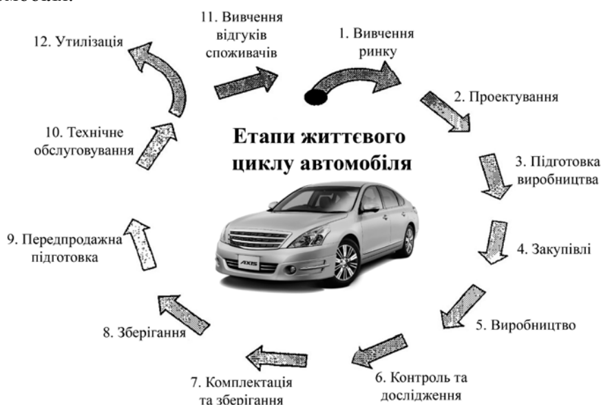
Рис. 1. Етапи життєвого циклу автомобіля

Життєвий цикл будь-якої продукції, у тому числі і легкового автомобіля, прийнято ділити на 12 етапів (рис. 1). На кожному з цих етапів здійснюються процеси, що впливають на якість автомобіля.