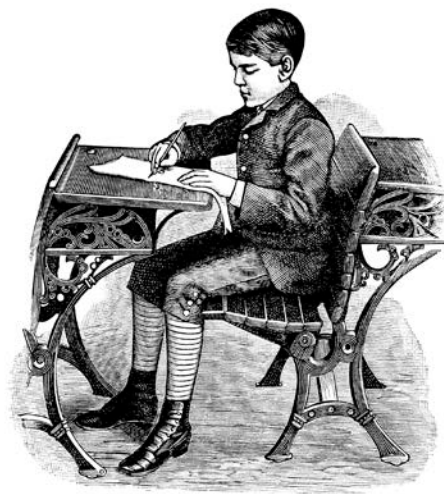
Рис. 2 Американський тип парти (ілюстрація з підручника 1890-х років)

У Західній Європі після Другої світової війни починається масова відмова від фіксованих парт: така жорстка конструкція вбачається надто тоталітарною (рис. 3) [10]. В Радянському Союзі парти активно вироблялись та використовувались навіть у 1980-і роки; в Україні окремі виробники досі пропонують комбіновані шкільні парти [3]. У Північній Америці вже на початку 20 сторіччя більшою популярністю користувалася одномісна парта (combo-desk) та стілець з робочою поверхнею, закріпленою на одному з локітників (tablet arm chair, рис. 4) [11, 12].