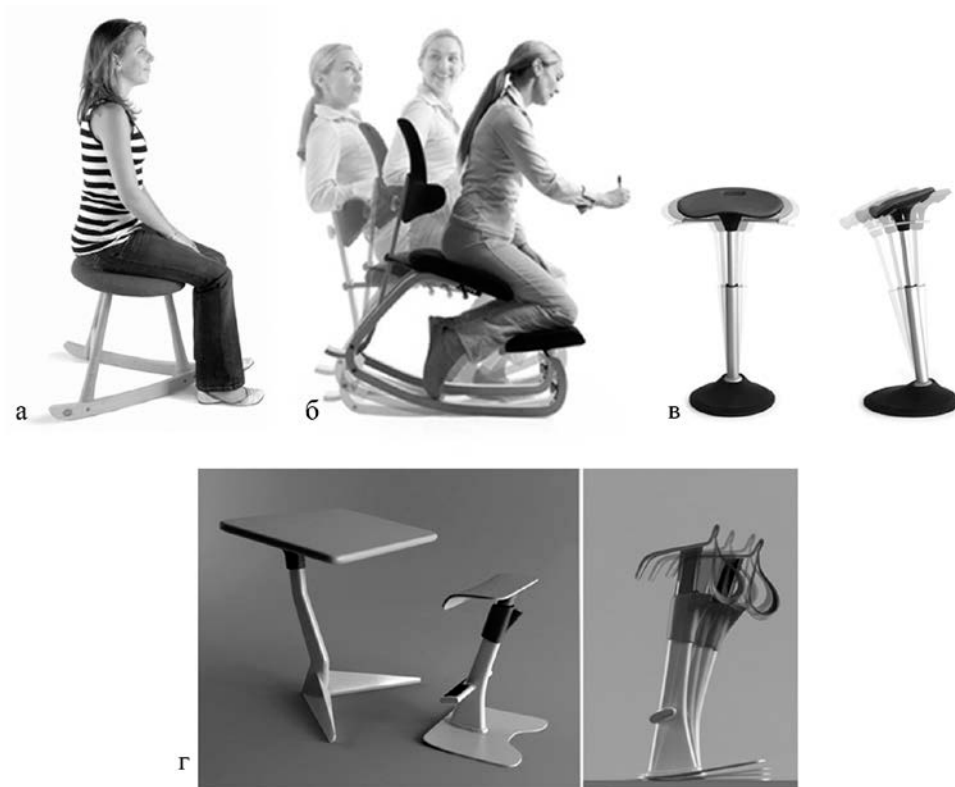
Рис. 6 Стільці для активного балансування:

Альтернативою фіксації робочої пози є сидіння, що стимулюють здорове положення тіла за рахунок активного балансування [13, 14, 15]. До таких пропозицій відносяться, зокрема, сидіння з нахилом уперед (forward-sloped chair) та ослони-гойдалки (rocker-stool). Подібні сидіння забезпечують набагато більшу варіативність робочої пози (рис. 6).