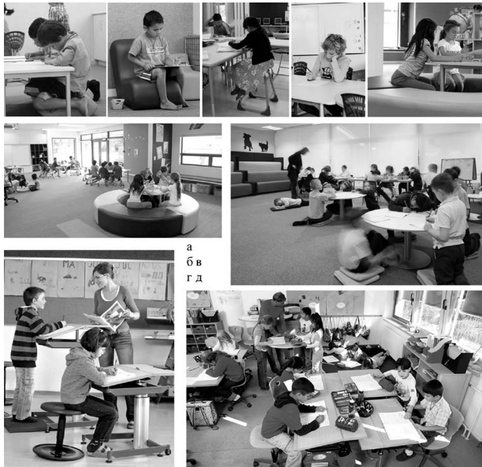
Рис. 7 Гнучкий навчальний простір:

а, б) Whitiora school, Нова Зеландія; в) Wychall Primary School, проектне бюро Penoyre & Prasad, Велика Британія; г) учнівські меблі для гнучкого навчального простору фірми Leitner, Німеччина; д) Fridtjof-Nansen-Schule, Ганновер; меблі фірми Vereinigte Spezialmöbelfabriken, Німеччина