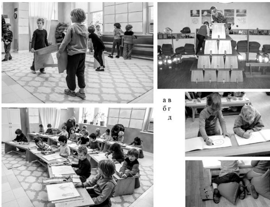
Рис. 8. Рухливий клас вальдорфської школи: а, б) The Waldorf School of Philadelphia, США; в) Freie Waldorfschule Balingen, Німеччина; г, д) Rudolf Steiner Schule in Hamburg-Nienstedten, Німеччина

Принагідно варто зазначити, що концепція «гнучкої класної кімнати» розроблялась свого часу також і у вітчизняній архітектурній науці [25]. Вітчизняна педагогічна теорія також наполягає на відході від виключно фронтального навчання, на розширенні форм та методів навчальної діяльності [17]. Проте активного використання у вітчизняній практиці подібні концепції досі не набули, відповідно, не змінюється і асортимент учнівських меблів. Перевага фронтальних методів навчання в українській школі не дозволяє в нашій країні сформуватись запиту на нові типи учнівських меблів.