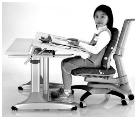
Рис. 5. Сучасний комплект учнівських меблів, створений за принципом жорсткої фіксації робочої пози

Проте усі ці зміни відбувались в рамках «ергономіки парти», що передбачає фіксацію робочої пози, фактичну неможливість працювати в іншому положенні, ніж єдине передбачене конструкцією комплекту. Як стандартизація [4], так і практика дизайну навчальних меблів, попри усі удосконалення, досі переважно ґрунтується на концепції фіксованої робочої пози учня (рис. 5).