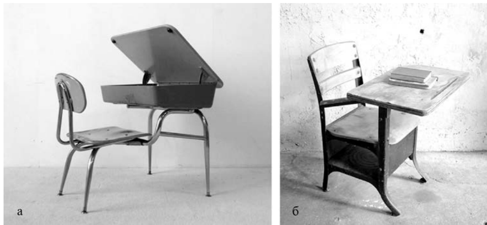
Рис. 4 Американські учнівські меблі: а) combo-desk, 1950-ті роки; б) tablet arm chair, 1960-ті роки

Проте усі ці зміни відбувались в рамках «ергономіки парти», що передбачає фіксацію робочої пози, фактичну неможливість працювати в іншому положенні, ніж єдине передбачене конструкцією комплекту. Як стандартизація [4], так і практика дизайну навчальних меблів, попри усі удосконалення, досі переважно ґрунтується на концепції фіксованої робочої пози учня (рис. 5).