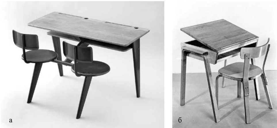
Рис. 3 Європейські учнівські меблі: а) парти 1940-х років, дизайнер Jean Prouve; б) комплект шкільних меблів, 1960-ті роки, дизайнер Alvar Aalto