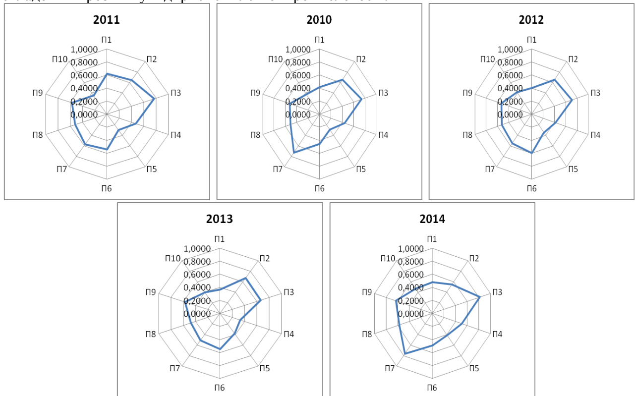
Рис. 2 Діаграма рівнів розвитку підприємств легкої промисловості

Результати розрахунку рівня розвитку досліджуваних підприємств представлені на рис. 2. Оцінка рівнів розвитку підприємств легкої промисловості було також проведена за кадровою, інвестиційно-інноваційною, техніко-технологічною та маркетинговою складовими розвитку підприємств легкої промисловості.